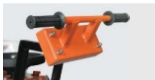
MANERE CU VIBRATII REDUSE