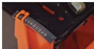
INDICATOR ADANCIME TAIERE